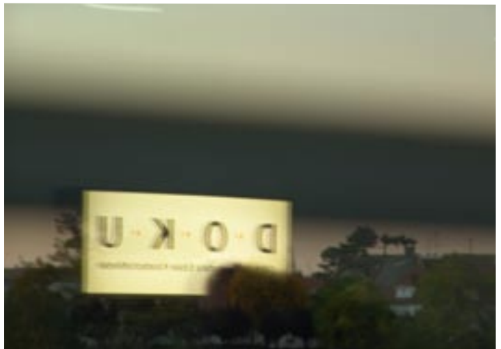
Abbild: altes Logo